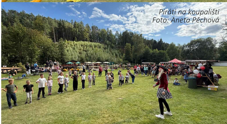
Piráti na koupališti